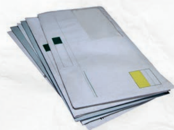
Enveloppes avec ou sans fenêtre