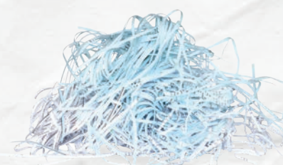
Papiers en lamelles passés au broyeur