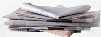
Journaux sans blister